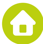
Schéma de la page d'accueil